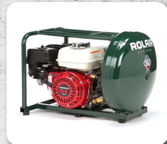
Armazón Rígido Protector