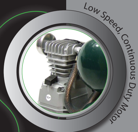
Low Speed, Continuous Duty Motor