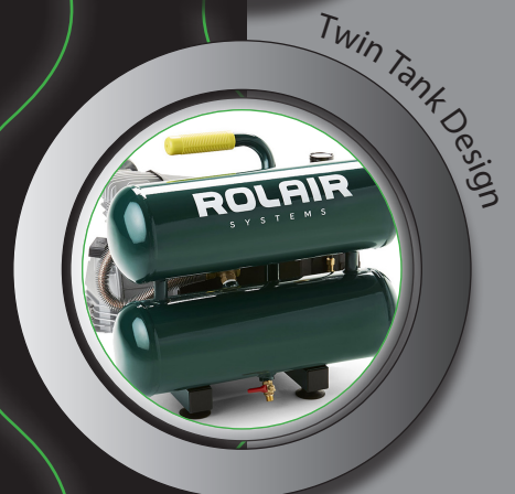
Twin Tank Design