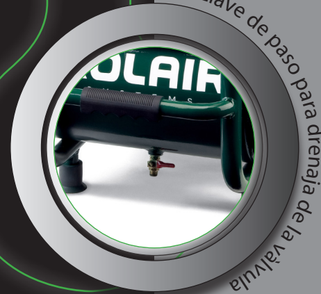
Llave de paso para drenaje de la válvula